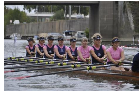
Bateau de Henley (club anglais)

Angers Nautique Aviron organise depuis 30 ans une compétition d'aviron, la « Coupe des Dames » dédiée au public féminin, associée à la « Coupe des Messieurs », disputée le lendemain. Ce sont plus de 500 rameuses et rameurs de loisir et/ou compétition, représentant d'une vingtaine de clubs français en majorité - mais des équipages étrangers participent depuis plusieurs années - qui viennent