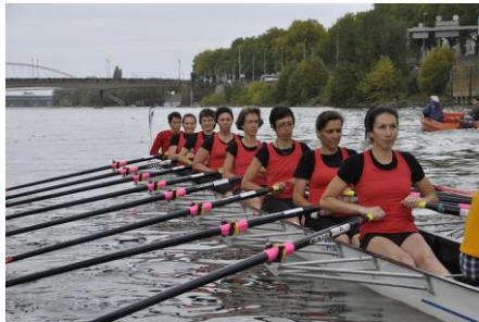
Bateau femme d'Angers

s'affronter sur notre magnifique plan d'eau et sur le bateau "roi" de l'aviron : le huit, puisque c'est son nom, est composé de huit rameurs ou rameuses, un barreur, mesure 18 mètres de long, pèse une tonne avec ses occupants et peut atteindre une vitesse de pointe de 20 kilomètres à l'heure.