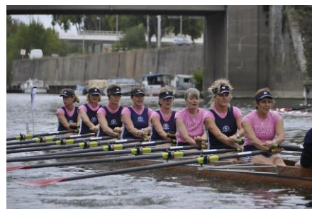
Bateau de Henley (club anglais)

Angers Nautique Aviron organise depuis 30 ans une compétition d'aviron, la « Coupe des Dames » dédiée au public féminin, associée à la « Coupe des Messieurs », disputée le lendemain. Ce sont plus de 500 rameuses et rameurs de loisir et/ou compétition, représentant d'une vingtaine de clubs français en majorité - mais des équipages étrangers participent depuis plusieurs années - qui viennent