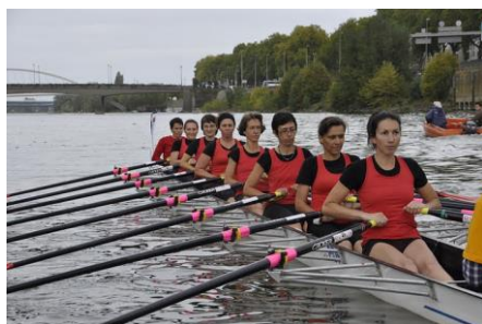
Bateau femme d'Angers

s'affronter sur notre magnifique plan d'eau et sur le bateau "roi" de l'aviron : le huit, puisque c'est son nom, est composé de huit rameurs ou rameuses, un barreur, mesure 18 mètres de long, pèse une tonne avec ses occupants et peut atteindre une vitesse de pointe de 20 kilomètres à l'heure.